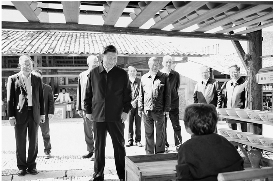
2023年10月10日至13日，中共中央总书记、国家主席、中央军委主席习近平在江西考察。这是11日上午，习近平在景德镇市陶阳里历史文化街区考察时，同非遗传承人亲切交流。

僵化和保守。马克思主义不排斥一切真理，不管它来自何时、来自哪里，只要是真理性认识，都可以作为丰富和发展自己的养分。我们要拓宽理论视野，以海纳百川的开放胸襟学习和借鉴人类社会一切优秀文明成果，在“人类知识的总和”中汲取优秀思想文化资源来创新和发展党的理论，形成兼容并蓄、博采众长的理论大格局大气象。