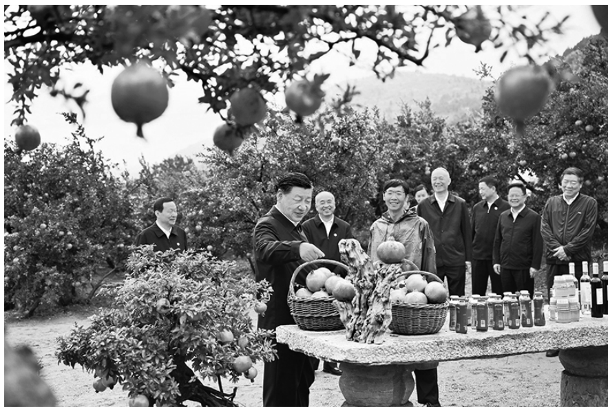
2023年9月24日，中共中央总书记、国家主席、中央军委主席习近平在浙江考察结束返京途中，来到山东省枣庄市考察。这是习近平在位于峰城区的冠世榴园石榴种植园了解石榴产业发展情况。新华社记者 燕雁 / 摄

的问题就能豁然开朗、找到答案。我们的各项工作实践要走好群众路线，推进党的理论创新也要走好群众路线，决不能闭门造车、坐而论道、流于空想。在谋划这次主题教育时，我提出大兴调查研究，就是要推动各级领导干部树牢唯物史观，强化群众观点和宗旨意识，坚持目标导向和问题导向，走出机关沉到基层一线，广泛倾听人民群众的声音，自觉问计于民、问需于民，运用党的创新理论研究解决好发展所需、改革所急、基层所盼、民心所向的突出问题，同时从人民群众的真知灼见中获取理论创新和实践创新灵感。要尊重人民首创精神，注重从人民的创造性实践中总结新鲜经验，上升为理性认识，提炼出新的理论成果，着力让党的创新理论深入亿万人民心中，成为接地气、聚民智、顺民意、得民心的理论。