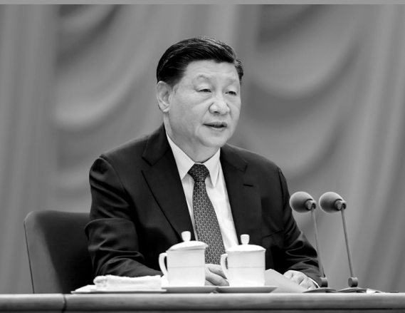
学习贯彻习近平新时代中国特色社会主义思想和党的二十大精神研讨班

九三学社重庆市委召开“凝心铸魂强根基、团结奋进新征程”主题教育动员会……陈 杨 (29)