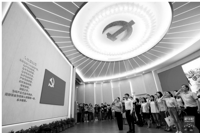
党员在上海中共一大纪念馆里重温入党誓词（2021年6月3日摄）。

一以贯之的思想洗礼——“每当党中央作出重大决策部署，我们就号召全党同志加强学习”