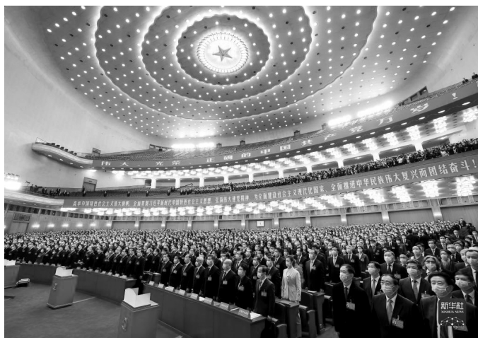
中国共产党第二十次全国代表大会在北京人民大会堂胜利闭幕（2022年10月22日摄）。

9年多前，正是在这里，习近平总书记首提“精准扶贫”重要理念，开启了这座深山苗寨的巨变。如今，总书记关于全面实施乡村振兴战略的一系列重要论述，又