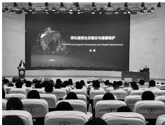
4月23日，九三学社中央院士专家科普行在忠县举行

工程院院士丛斌作了题为《消化道微生态稳态与健康维护》的主题报告。活动期间，院士专家科普团成员还深入学校、企业、社区等围绕文旅融合发展、乡村振兴、发展新质生产力等开展主题调研，为当地经济社会发展提出意见建议。九三学社重庆市委社会服务处、办公室、组织处、宣传处负责人，相关区县领导干部、学校师生代表、九三学社社员代表等近3000余人参加了报告会。大家一致表示，九三学社深入贯彻落实习近平总书记关于科学普及工作的重要讲话重要指示精神，充分发挥九三学社的科技特色和优势，举办的九三学社中央院士专家科普行活动十分精彩、十分受用，集中向地方干部和学生教师普及了科学知识、传播了科学思想、弘扬了科学精神，为助推谱写中国式现代化重庆篇章贡献九三学社力量。（通讯员：刘倩）