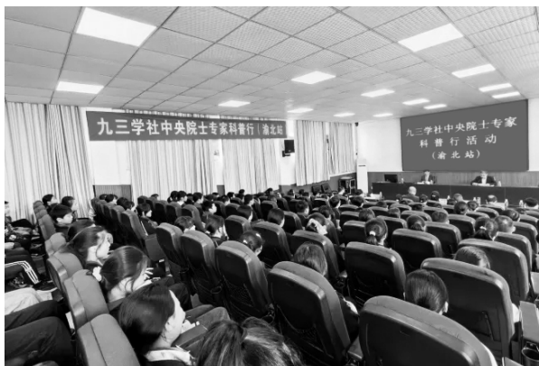
4月23日，九三学社中央院士专家科普行在渝北区举行

4月23日至28日，全国人大常委会委员、宪法和法律委员会副主任委员，九三学社中央副主席，中国工程院院士丛斌等社内院士专家学者来渝开展九三学社中央院士专家科普行活动，在重庆市渝中区、大渡口区、江北区、渝北区、綦江区、合川区、忠县、秀山县等地开展科普讲座。九三学社中央社会服务部二级调研员杨丽珍，九三学社重庆市委专职副主委黄华、秘书长汪科君出席相关活动。