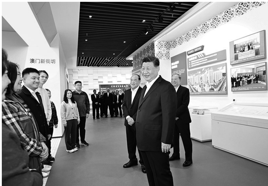
2024年12月19日上午，中共中央总书记、国家主席、中央军委主席习近平在澳门特别行政区行政长官贺一诚陪同下，来到横琴粤澳深度合作区考察。这是习近平在横琴天沐琴台展示厅澳门新街坊项目展区前，同居住在这里的市民代表亲切交谈。

改革不是改旗易帜。我多次讲，我们的改革是有方向、有原则的。坚持党的全面领导、坚持马克思主义、坚持中国特色社会主义、坚持人民民主专政，以促进社会公平正义、增进人民福祉为出发点和落脚点，这些都是管根本、管方向、管长远的，体现党的性质和宗旨，符合