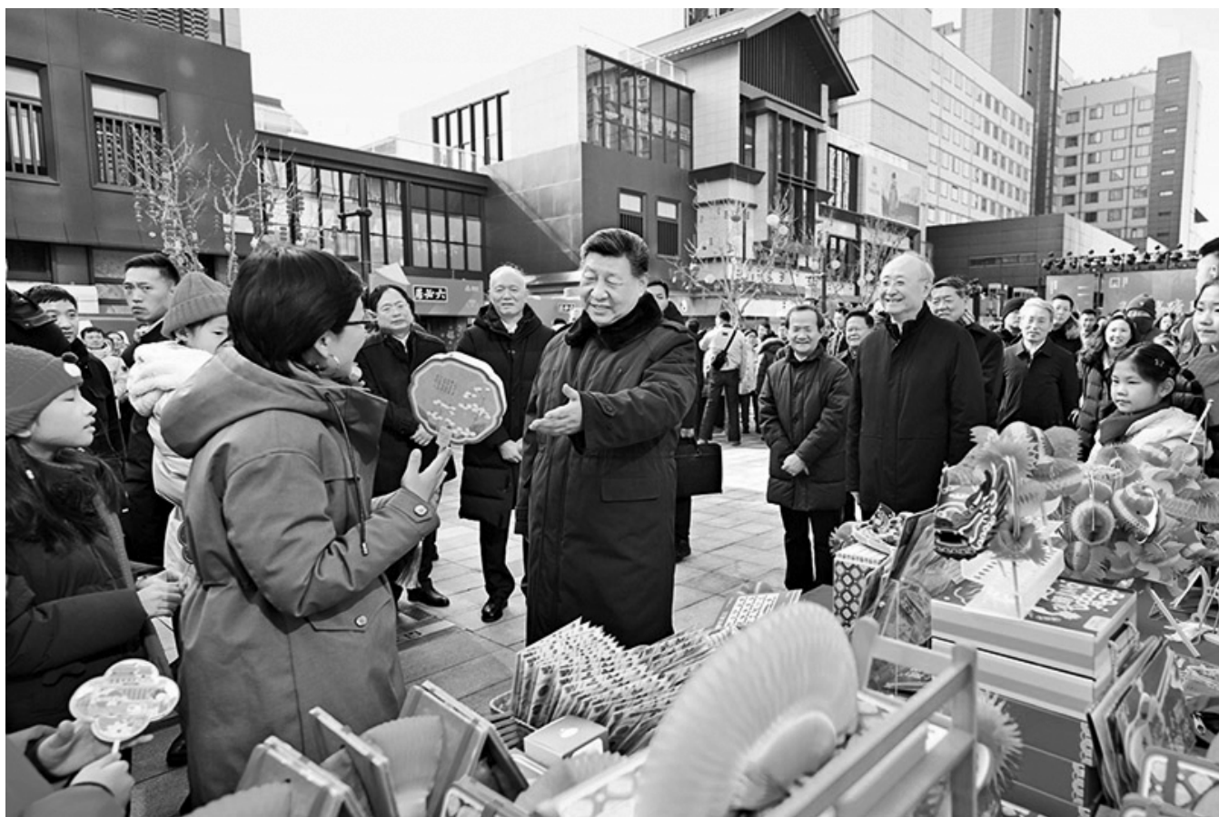
2026 年 2 月 9 日至 10 日，中共中央总书记、国家主席、中央军委主席习近平在北京考察并看望慰问基层干部群众。这是 10 日上午，习近平在东城区隆福寺街区新春市集考察时，同现场群众亲切交流。

※ 这是习近平总书记 2025 年 12 月 10 日在中央经济工作会议上讲话的一部分。