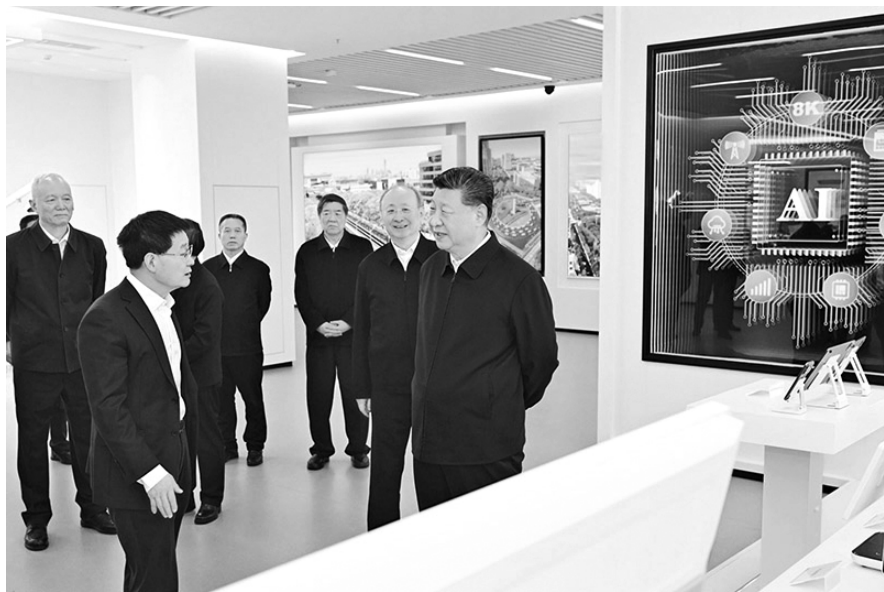
2026年2月9日至10日，中共中央总书记、国家主席、中央军委主席习近平在北京考察并看望慰问基层干部群众。这是9日上午，习近平在位于北京亦庄的国家信创园考察。

案，完善民营经济促进法配套法规政策，推动中小企业专精特新发展。大力弘扬企业家精神，促进年轻一代企业家健康成长。加紧清理拖欠企业账款。推动平台企业和平台内经营者、劳动者共赢发展。拓展要素市场化改革试点，深化电力体制改革，稳步推进供水、供气、供热等公用事业价格改革，促进可持续经营。深化零基预算改革，提高国有资本收益收取比例。优化财政转移支付结构，健全地方税体系。规范商业银行竞争秩序，深入推进中小金融机构减量提质。持续深化资本市场投融资综合改革，提高直接融资、股权融资比重。